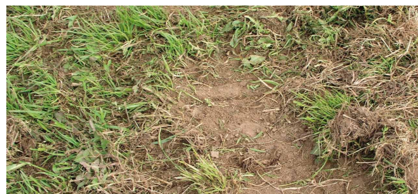
Mezerovitost v porostech po suchých letech.