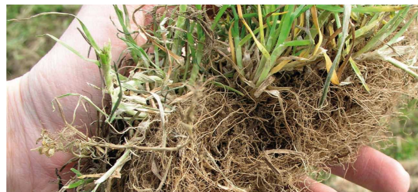
... a lipnice obecná